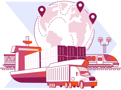
Denizler ve iç sular, kara yolları ve demir yollarında faaliyet gösteren nakliye şirketleri