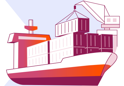
Nihai alıcılar (deniz taşımacılığında)